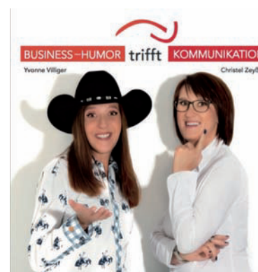
...mit den Powerfrauen: