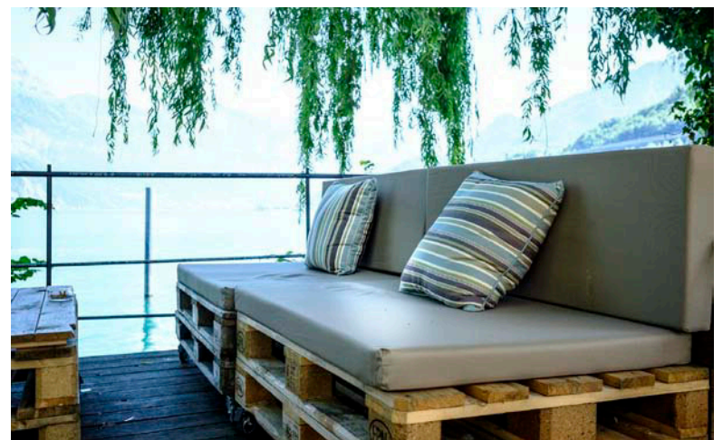
...in gemütlicher Lounge und in einzigartigem Ambiente am Walensee